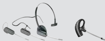
SAVI 440/445 Convertible