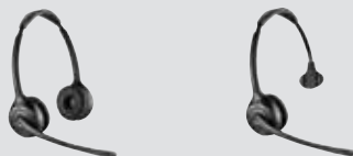
SAVI 420 Modèle serre-tête (binaural)